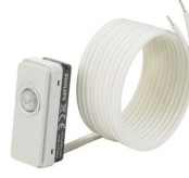
LRM8119/00 Lum Based Ext Sensor with LCA8004/00 COVER