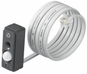
LRM1663/00 ActiLume gen2 Multi-Sensor