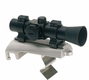
Zařizení pro přesné zaměření