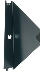
Simple aiming device