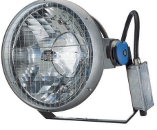
MVF403 - MASTER MHN-LA - 1000 W